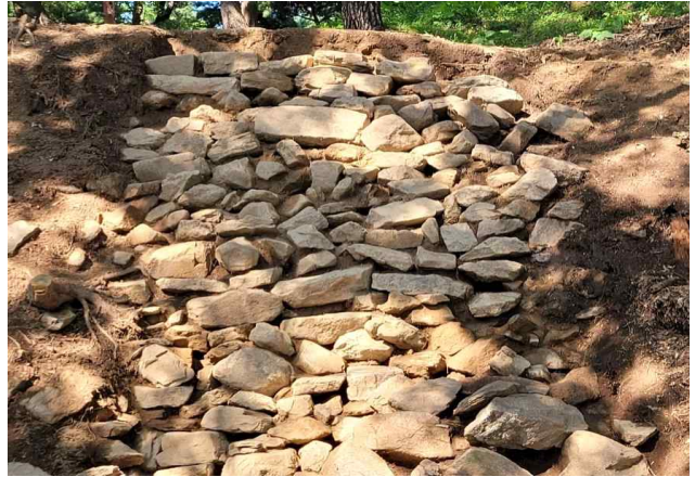
6트렌치 석축 상단