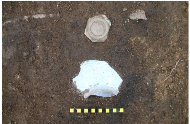
4트렌치 출토 유물