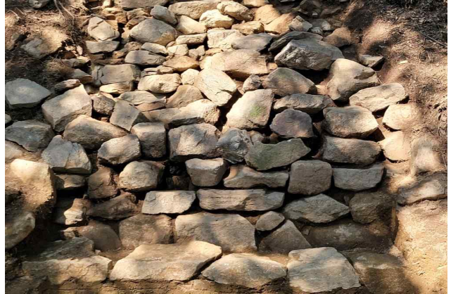
6트렌치 석축 하단(후대 석축)