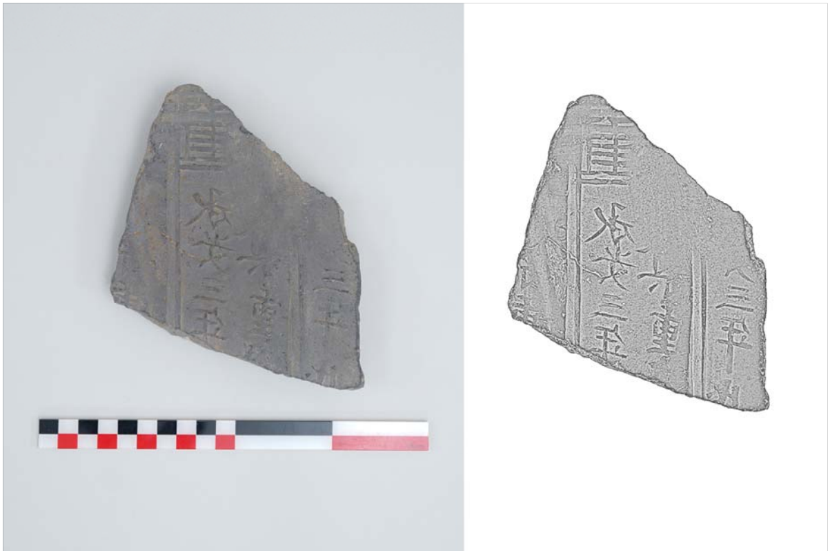
<출토 '承安三年'명 암기와>