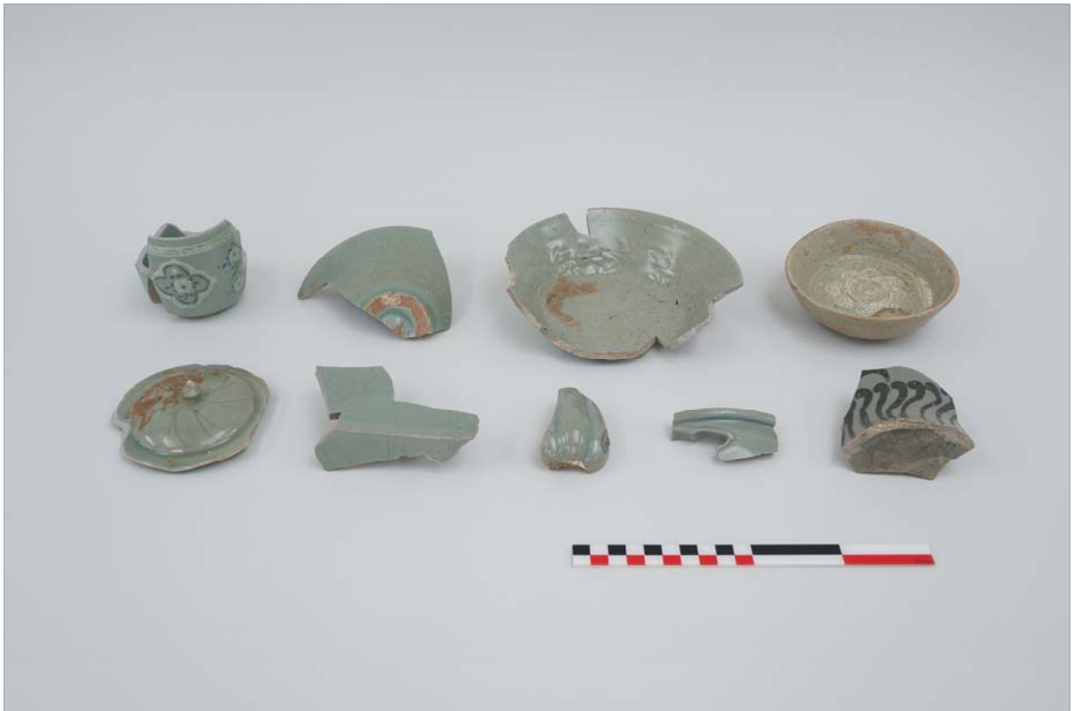
<출토 고려청자 일괄>